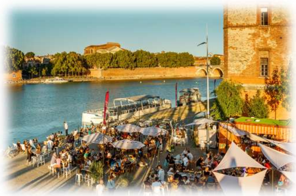
Arnaud Späni 7