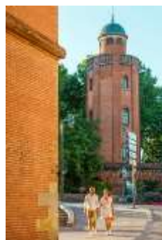
Arnaud Späni 5

A l'occasion du 100 e anniversaire de la naissance de Jean Dieuzaide, un site à découvrir absolument. Programmation / expositions : en attente information.