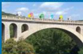
La Tour de France 2021 passe à Cérêt