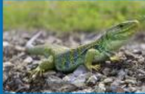
Les vigneron·nes protègent le lézard ocellé