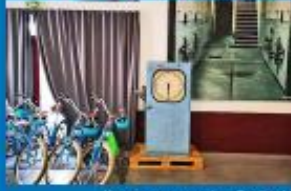
Voyage gourmand en Occitanie