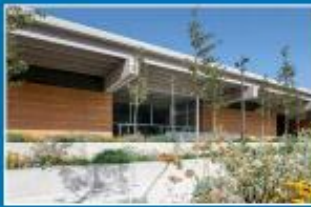
Ouverture du musée Narbo Via Plains Feux : p. 12