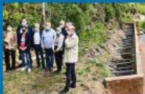
Vole Verte des Cévennes : travaux en cours