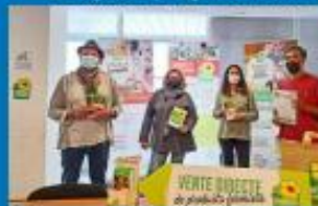
Aude : le guide Bienvenue à la Ferme