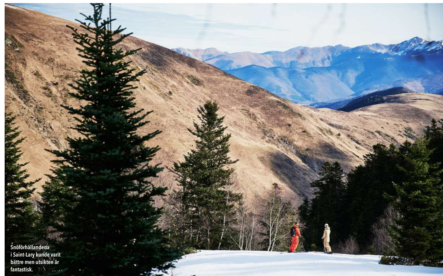
Snöförhållanden i Saint-Lary kunde varit bättre men utsikten är fantastisk.