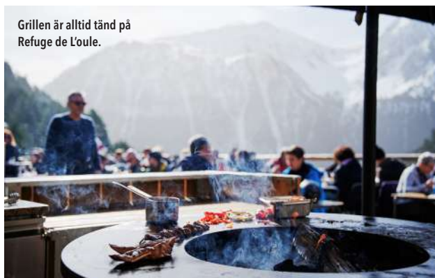
Grillen är alltid tänd på Refuge de Loule.