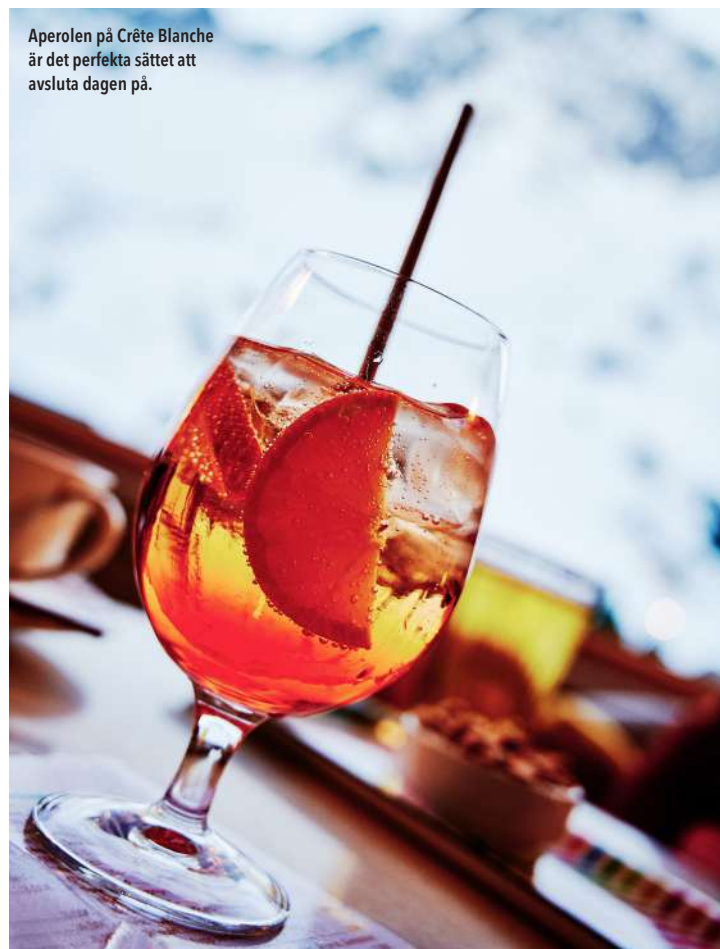
Aperolen på Crête Blanche är det perfekta sättet att avsluta dagen på.

Gastein var Cauterets i slutet av 1800-talet en kurort till vilken aristokratin vallfärdade för att bada i de varma källor som ansågs vara hälsobringande. De varma källorna finns fortfarande kvar, nu inkapslade i ett stort badhus mitt i byn.