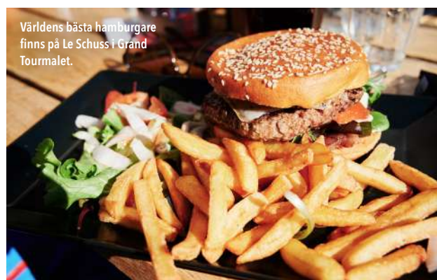
Världens bästa hamburgare finns på Le Schuss i Grand Tourmalet.

konstatera att vi har dels har överlevt, dels har åkt bättre åk under vår tid som skidåkare.