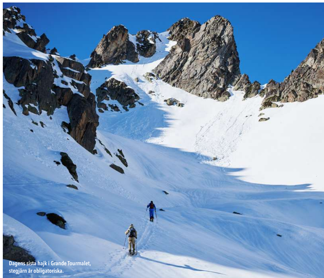
Dagens sista hajk i Grande Tourmalet, stegjärn är obligatoriska.

Det slutar med att en något bitter Walfroid får visa oss standardrutten ned från berget. Även här är det superisigt och flera gånger känns det som om någon av oss ska få felskär och kana tvåhundra meter ned över sten och grästuvor. Åket mynnar så småningom ut i den blå transportpisten Gaubie och vi kan