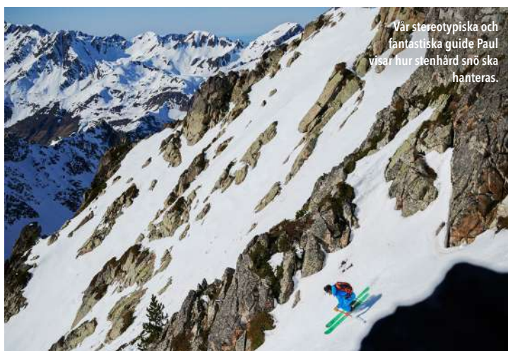
Vår stereotypiska och fantastiska guide Paul visar hur stenhård snö ska hanteras.