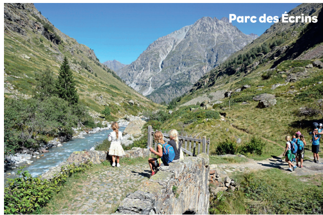
Parc des Écrins