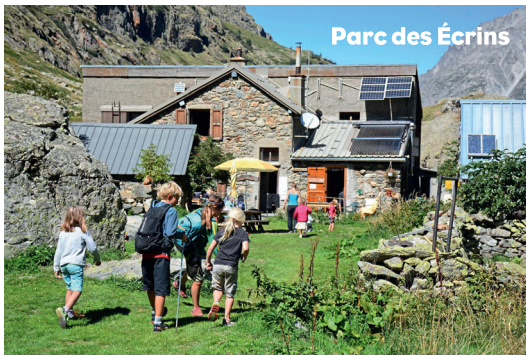
Parc des Écrins