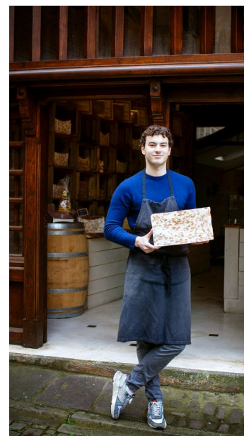
Upp i de äldsta delarna av Cordes-sur-Ciel ligger en liten butik som säljer nougat och marmeladgodis.

och marmeladgodis samt några restauranger. Men framför allt åker man hit för skönheten.