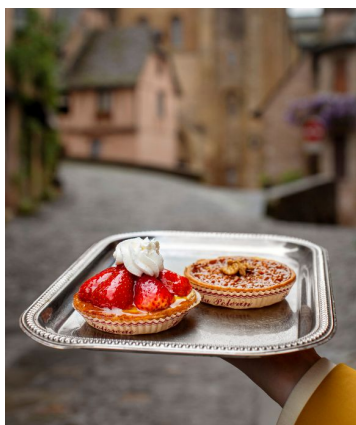
Två tarteletter från ett konditori i Conques, bakade på nötter från byns många valnötsträd.