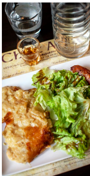
På Chez Anna i Belcastel serveras klassisk mat från Aveyron, som korv med truffad.