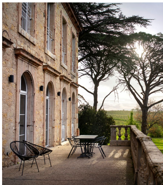
Före detta godset Château de Tautzies är numera en vingård med hotell en bit från Cordes-sur-Ciel.