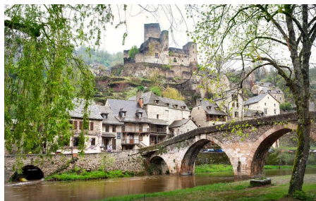
Den vackra stenbron och fortet är två av Belcastels mest kända byggnadsverk.