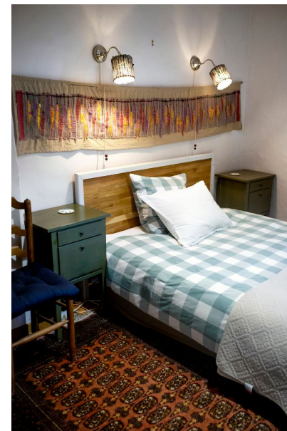
Eletha är ett litet bed and breakfast i Najac, där rummen dekorerats med bonader vävda av värden.