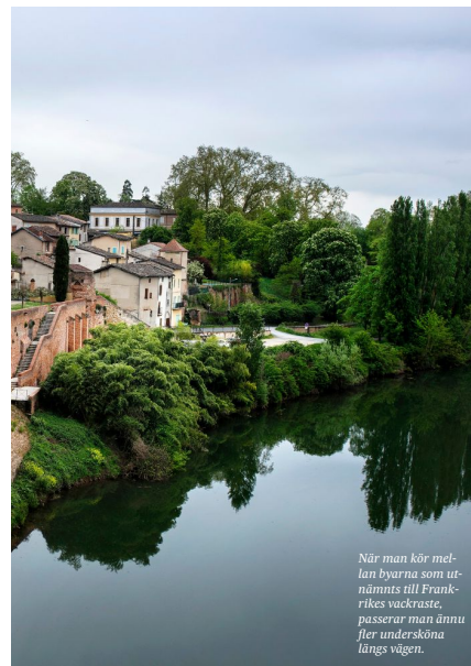
När man kör mellan byarna som utnämns till Frankrikes vackraste, passerar man ännu fler undersköna längs vägen.