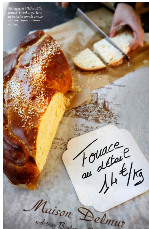
På bageriet i Najac säljs focuace, en lokal variant av brioche som är smaksatt med apelsinblomvatten.