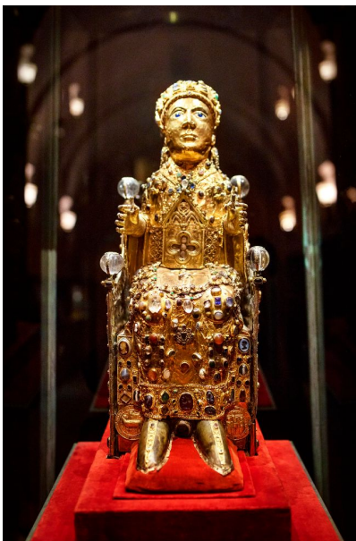
I Conques kan man beskåda en skattkammare full av relikier, guldästutor och andra dyrgrisar.