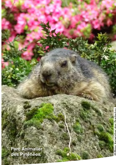
Parc Animalier des Pyrénées.