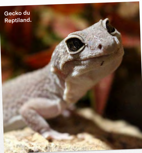
Gecko du Reptiland.

••• du Gévaudan. Dormirez-vous dans l'une des Tanières du parc? Billet couplé avec la Réserve des Bisons d'Europe. Sur le même thème, la Maison des loups , à Orlu (Ariège).