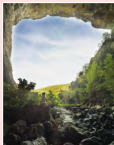
Grotte du Mas d'Azil