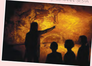
Grotte de Niaux

Nine a déniché deux grottes fabuleuses à visiter en Ariège. La première, la grotte de Niaux, s'étend sur plus de deux kilomètres de galeries spacieuses et comporte des lacs souterrains. Tu évolueras dans le noir avec un guide, éclairé uniquement par des lampes portatives pour découvrir les merveilles de ce lieu, dont la salle majestueuse du Salon Noir. Dans celle-ci, nos ancêtres ont réalisé plus de 70 peintures d'animaux : bisons, chevaux, bouquetins... Tu veux en savoir plus sur les hommes préhistoriques? Pars vite à la découverte la Grotte du Mas-d'Azil, classée Monument historique depuis 1942. Ta visite se déroulera en plusieurs étapes. Tout d'abord, tu découvriras la vie des premiers hommes qui ont occupé le site. Puis, tu revivras les fouilles des archéologues lors de la visite guidée. Enfin, tu découvriras dans le musée une riche collection d'objets préhistoriques provenant de la grotte.