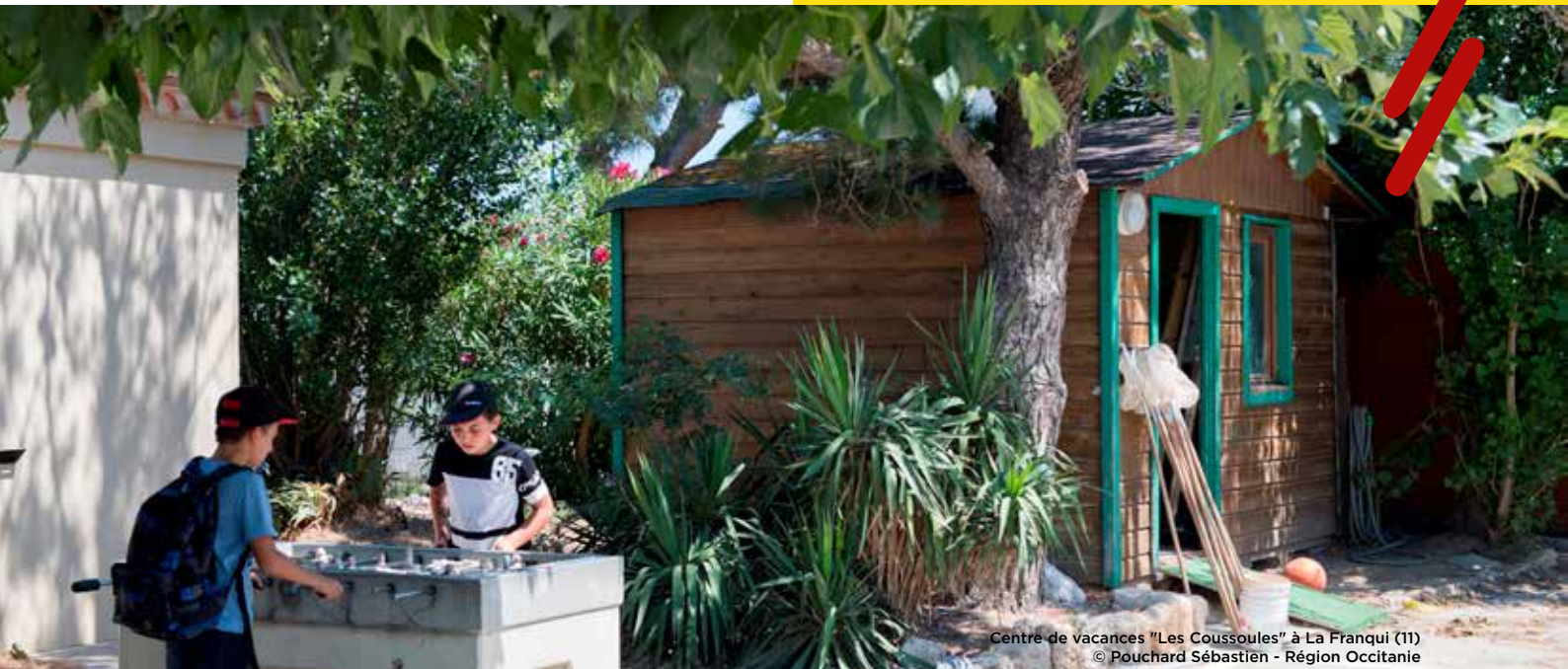
Centre de vacances "Les Coussoules" à La Franqui (11)