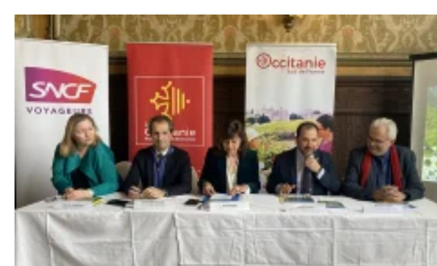
Présentation de l'Occitanie Rail Tour le 17/04/2023