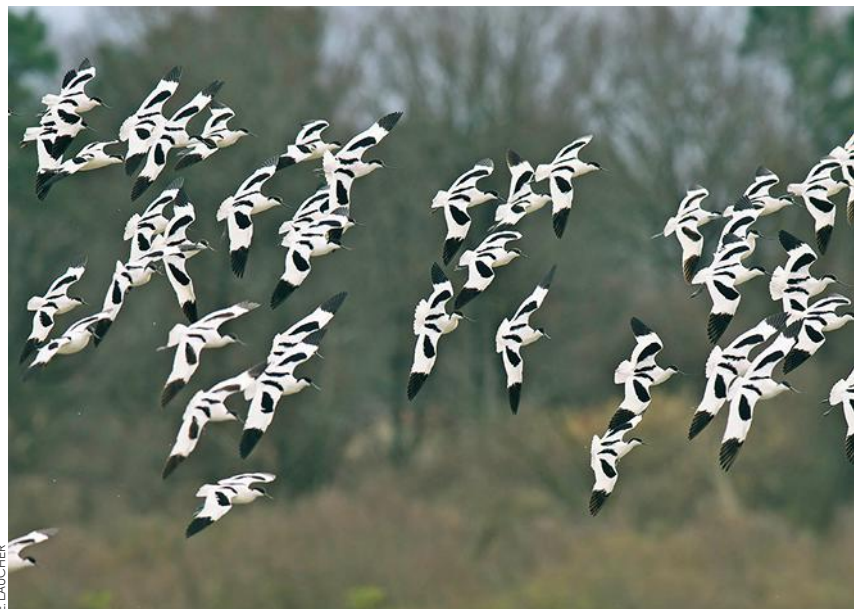
Depuis 1972, 327 espèces ont été observées (ici des avocettes élégantes).

Tous les jours de 10 à 19 heures (20 heures en juillet-août). 9,80 €/adulte, 7,60 €/enfant dès 5 ans. Reserve-ornithologique-du-teich.com