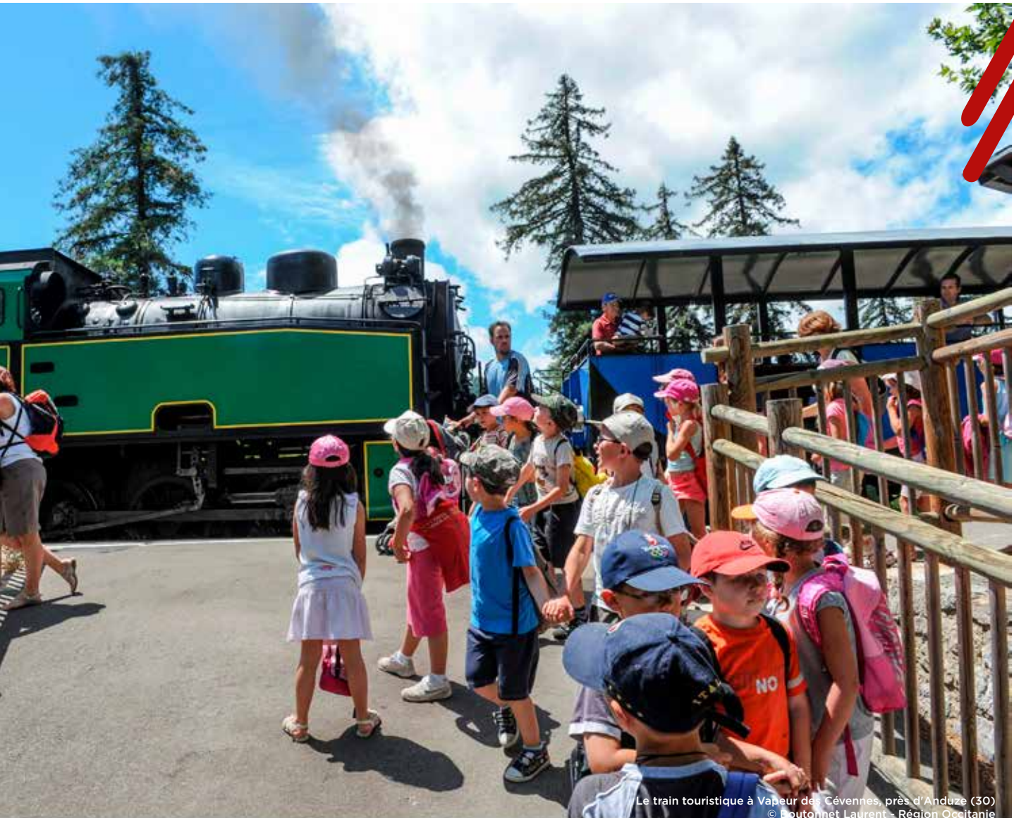
Le train touristique à Vapeur des Cévennes, près d'Anduze (30)

La Région accorde une subvention annuelle de 625 000€ pour financer cette opération sur l'ensemble du territoire, aux côtés des autres partenaires.