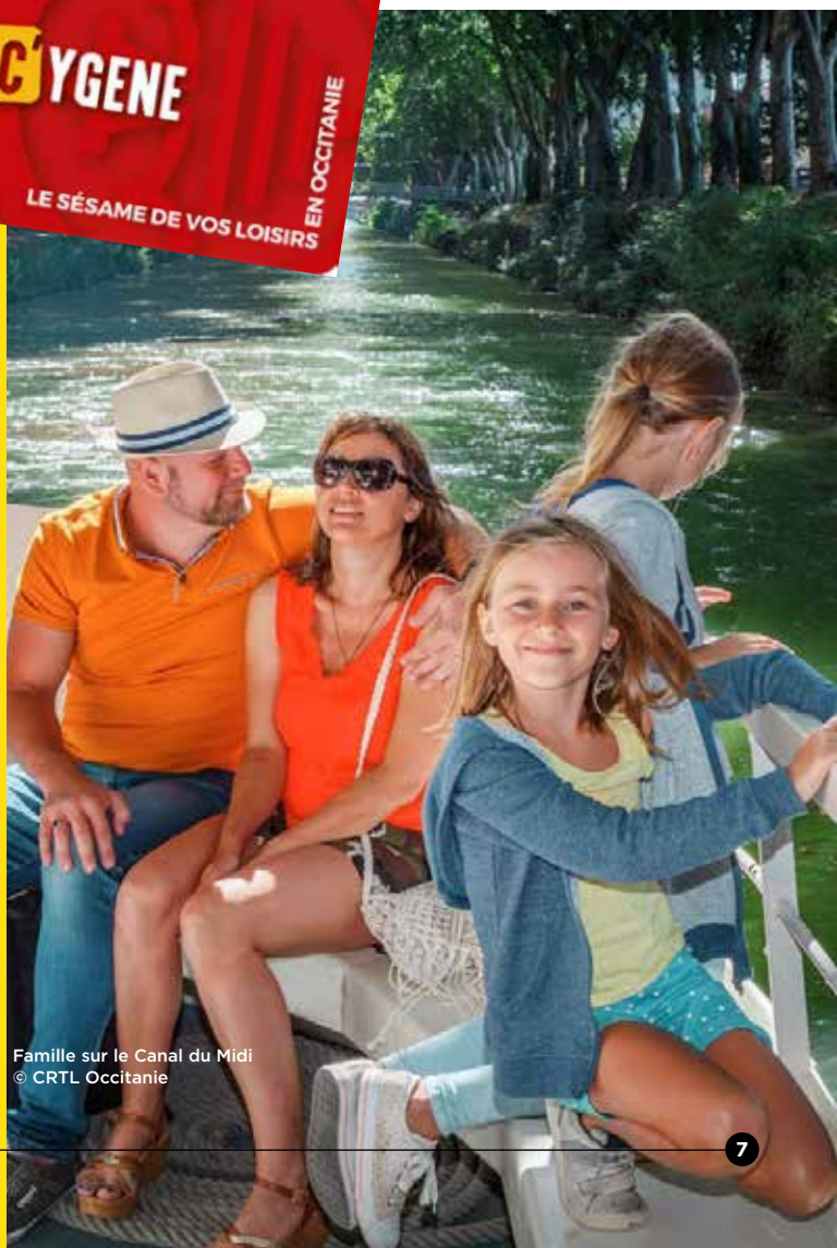
Famille sur le Canal du Midi

Toutes les offres de la carte Occ'Ygène sont en ligne sur voyage-occitanie.com