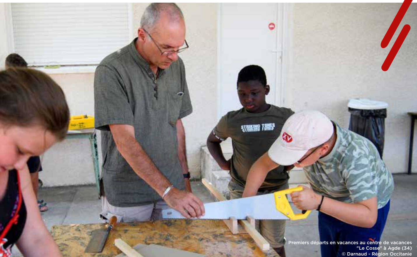
Premiers départs en vacances au centre de vacances "Le Cosse" à Agde (34)