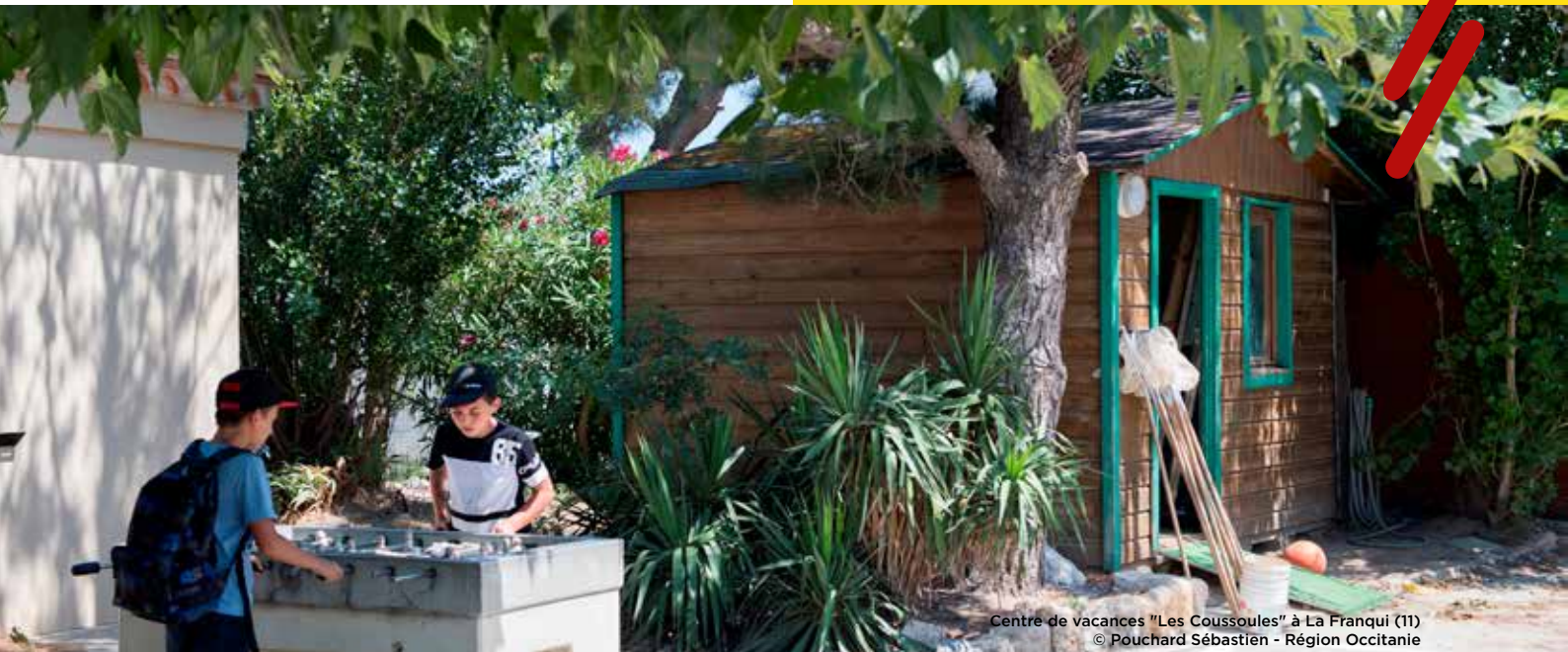
Centre de vacances "Les Coussoules" à La Franqui (11)