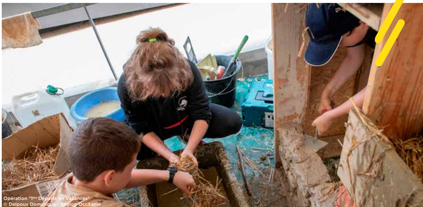
Opération "1ers Départs en Vacances"