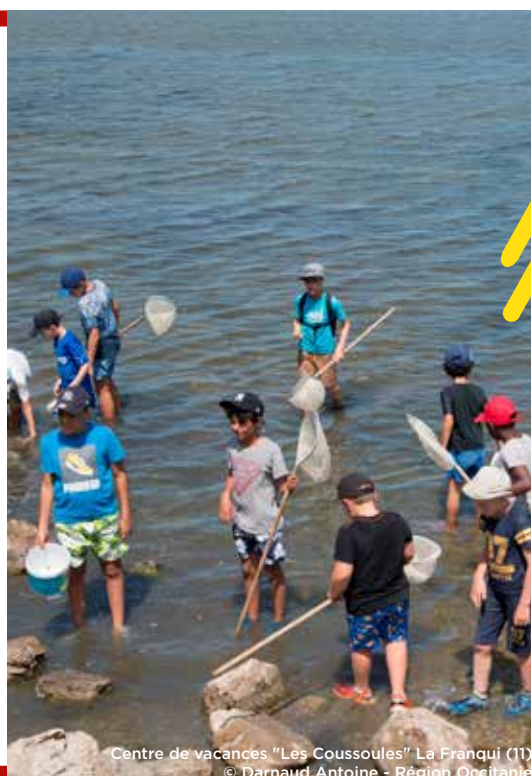
Centre de vacances "Les Coussoules" La Franqui (11)

Une convention de mécénat sera établie pour formaliser cet engagement et l'usage du don.