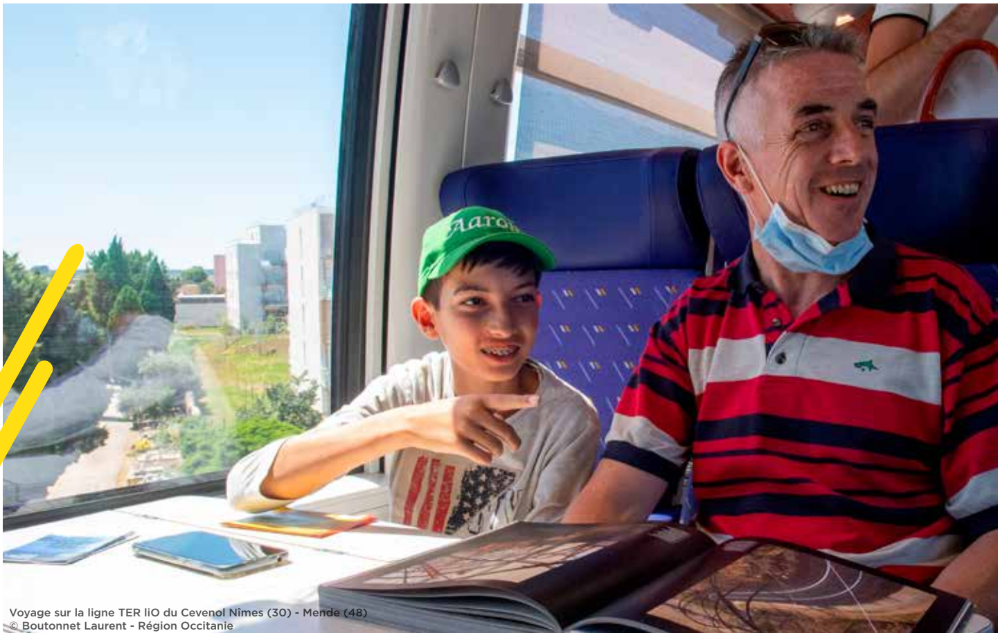
Voyage sur la ligne TER liO du Cevenol Nîmes (30) - Mende (48)

Tout au long de l'année, les jeunes de 18 à 26 ans peuvent également bénéficier de la gratuité à l'usage des trains liO grâce au programme "+=0" (Plus de 55 000 inscrits à ce jour). Le dispositif sera étendu et accessible dès 16 ans à partir de la rentrée de septembre 2023.