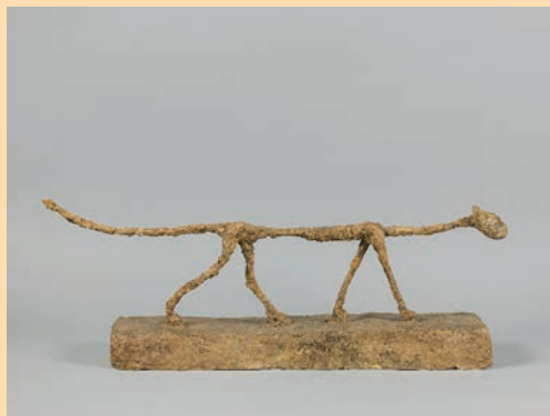
Alberto Giacometti Le Chat , 1951 Plâtre peint 32,8 x 81,3 x 13,5 cm Fondation Giacometti © Succession Alberto Giacometti / Adagp, Paris 2023