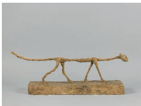
Alberto Giacometti Le Chat , 1951 Plâtre peint 32,8 x 81,3 x 13,5 cm Fondation Giacometti © Succession Alberto Giacometti /Adagp, Paris 2023

Commissaire, scénographe, choisissant les œuvres, modifiant l'accrochage jusqu'au dernier moment, comme en témoignent ses notes et croquis, Giacometti révèle sa haute conscience du soin à apporter à la diffusion de son travail, qu'il partage lors de nombreux entretiens avec des critiques d'art de son temps.