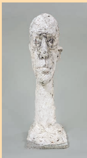
Alberto Giacometti Grande tête , 1960 Plâtre peint 100,5 x 31,7 x 43,1 cm Fondation Giacometti © Succession Alberto Giacometti / Adagp, Paris 2023