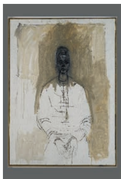
Alberto Giacometti Caroline en larmes, 1962 Huile sur toile - 100 x 73 cm Fondation Giacometti

Sa seule collaboration théâtrale aboutie se fait à la demande de Beckett, pour la réalisation du décor de la pièce En attendant Godot dans sa reprise au théâtre de l'Odéon en 1961, pour lequel il pense une sculpture d'arbre. Giacometti crée dans une formidable économie de moyens un monde autre, celui du "théâtre de l'absurde" imaginé par Beckett dans sa pièce. L'intérêt de Giacometti pour le théâtre ne se situe pas dans l'illustration ou la recherche de motifs, mais il lui permet de s'interroger sur l'articulation entre le réel et l'imaginaire.