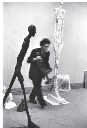
Henri Cartier-Bresson, Alberto Giacometti installant son exposition à la galerie Maeght, Paris, 1961, 1961 photographie