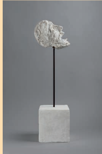
Alberto Giacometti Tête sur tige , 1947 Plâtre peint – 54 x 19 x 15 cm Fondation Giacometti © Succession Alberto Giacometti / Adagp, Paris 2023