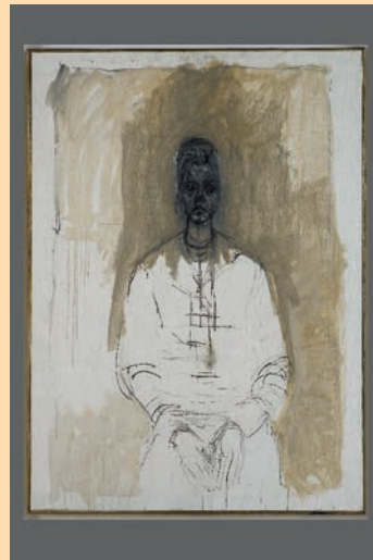
Alberto Giacometti Caroline en larmes, 1962 Huile sur toile – 100 x 73 cm Fondation Giacometti