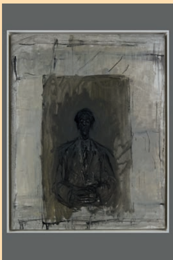
Alberto Giacometti Isaku Yanaihara , 1956 Huile sur toile – 81,4 x 65,2 cm Fondation Giacometti © Succession Alberto Giacometti / Adagp, Paris 2023

https://www.lesabattoirs.org/espace-presse/