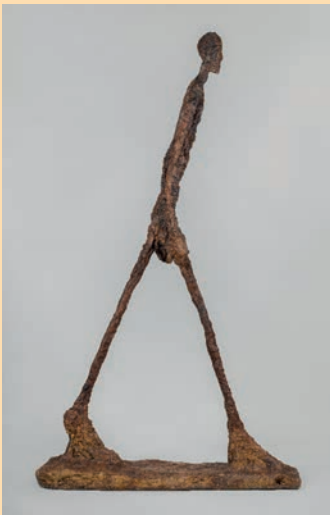
Alberto Giacometti L'Homme qui marche II , 1960 Plâtre – 188,5 x 29,1 x 111,2 cm Fondation Giacometti © Succession Alberto Giacometti / Adagp, Paris 2023