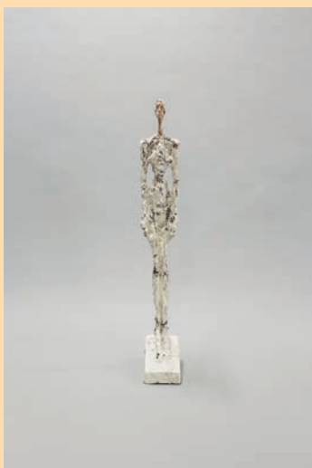
Alberto Giacometti Femme de Venise I , 1956 Plâtre peint – 108,5 x 17 x 30 cm Fondation Giacometti © Succession Alberto Giacometti / Adagp, Paris 2023