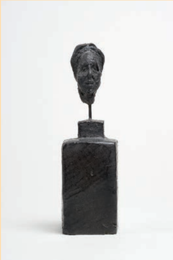
Alberto Giacometti Simone de Beauvoir , 1946 Bronze – 13,5 x 4,1 x 4,1 cm Fondation Giacometti © Succession Alberto Giacometti / Adagp, Paris 2023

https://www.lesabattoirs.org/espace-presse/