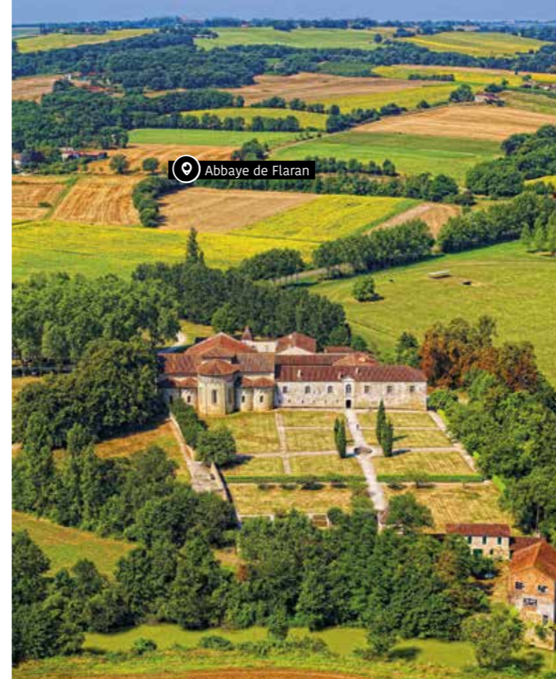
Abbaye de Flaran