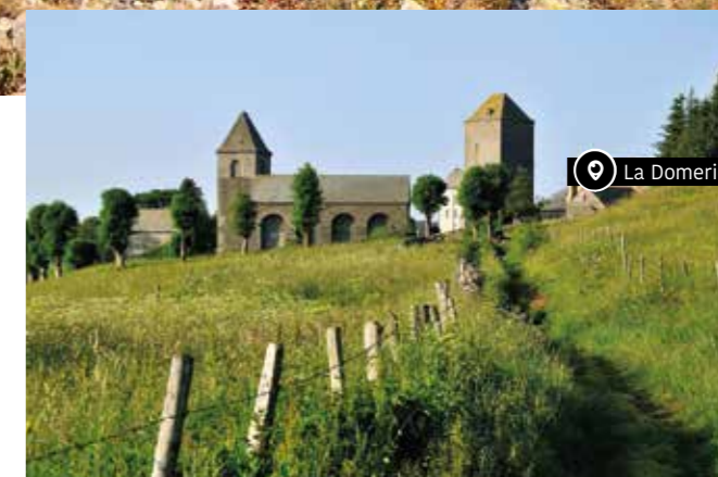
📍 La Dômerie d'Aubrac