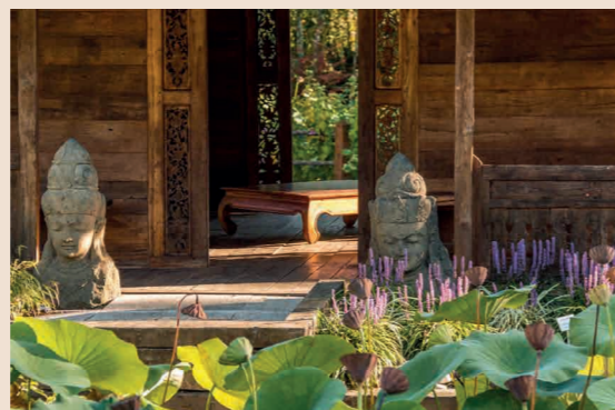
Jardin des Martels