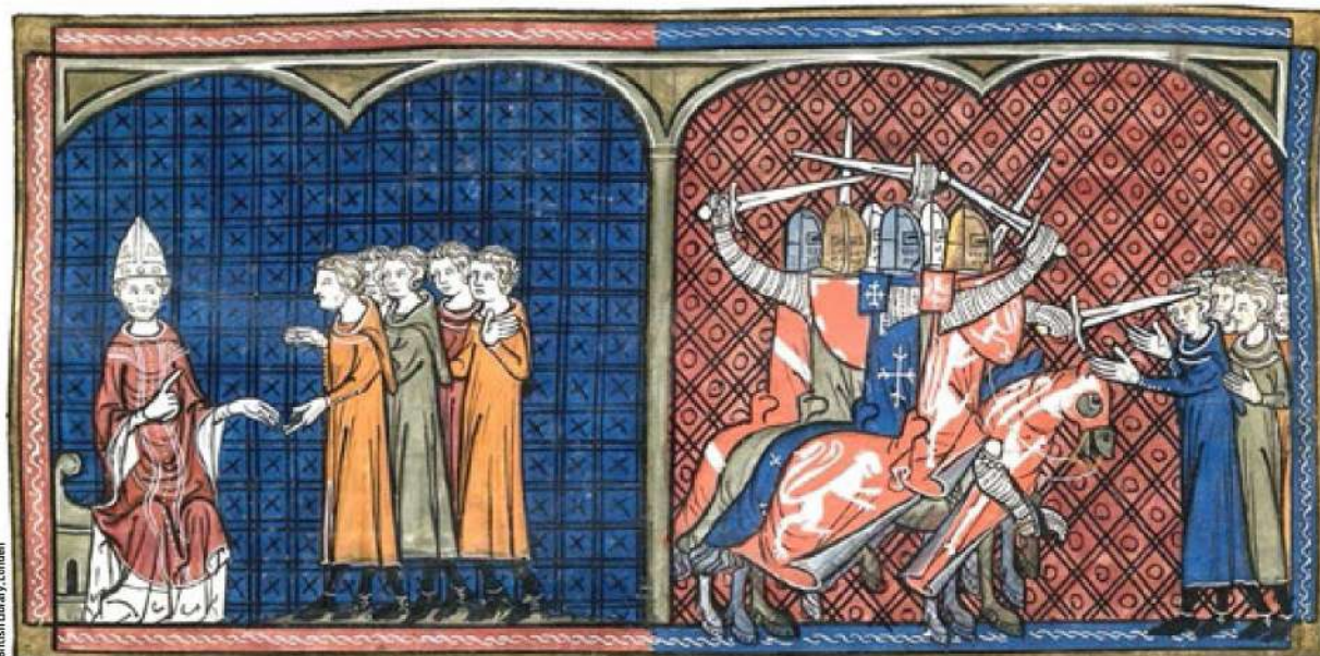
British Library, Londen

in een identiteitsmythe hebben veranderd. In de laatste decennia is het idee gegroeid dat ze de helden en slachtoffers waren van een verzetstrijd tegen de “noordelijke kruisridders”. Sommige mensen identificeren zich met hen en vinden het ondraaglijk dat deze pijnlijke geschiedenis opnieuw wordt onderzocht.’