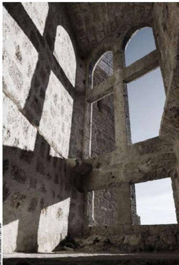
Berthold Steinhilber / Laif / ANP

Het waren niet alleen religieuze verschillen die tot verdere escalatie leidden. Als altijd was er ook de politiek. De Languedoc was nog geen deel van een centraal, goed geregeerd koninkrijk en dus een vat vol mogelijkheden voor ambitieuze types. Lokale edelen probeerden hun macht uit te breiden en buitenlandse spelers – zoals de Engelse koning – trachtten delen in handen te krijgen. Bij dit machtsspel was het gebruikelijk om tegenstanders van ketterij te betichten, in de hoop ze zwart te maken en zelf steun te