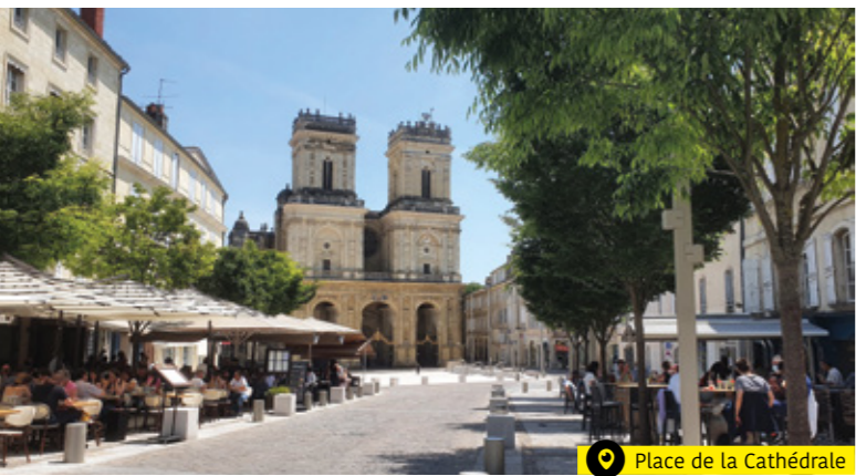
Place de la Cathédrale