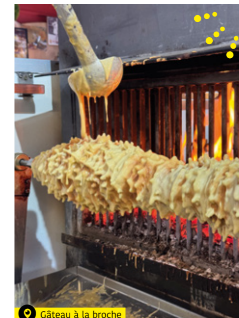
Gâteau à la broche