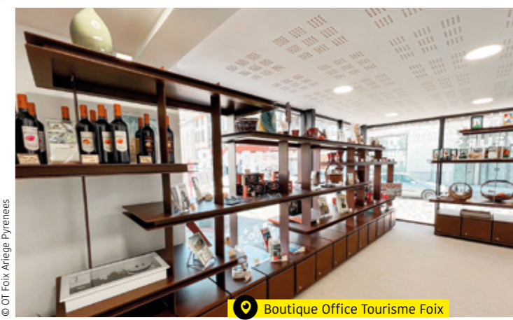
Boutique Office Tourisme Foix