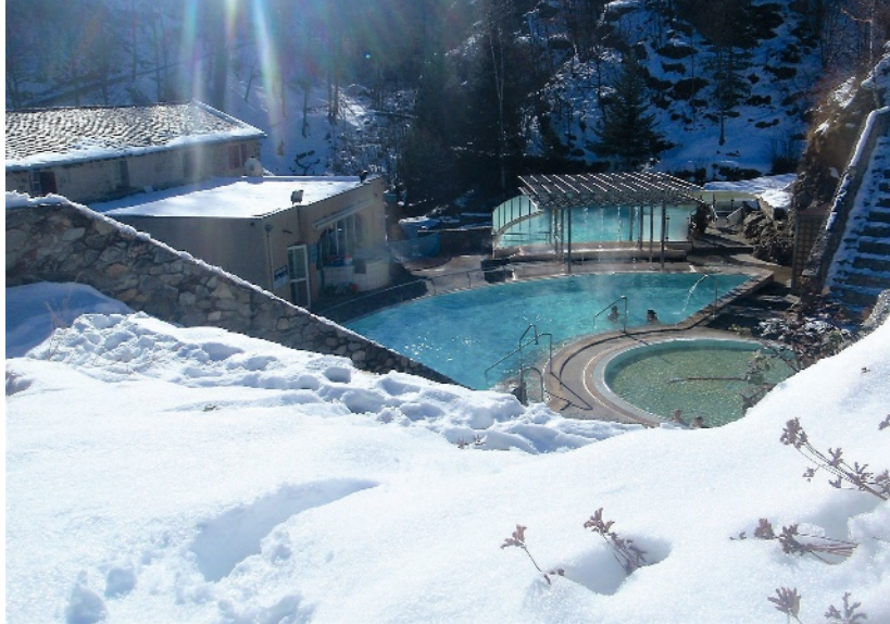
BAINS DE SAINT-THOMAS - STEPHANEFORTAS

Dans l'Hexagone, les Pyrénées sont particulièrement réputées pour leurs sources chaudes et bains naturels. Les Hautes-Pyrénées, notamment, arborent « la plus grande collection de France » de centres thermoludiques et de spas en eau thermale. Ce sont les Romains, grands amateurs de thermalisme, qui ont découvert les bienfaits des eaux thermales pyrénéennes et ont construit de nombreux bains publics. Cet héritage précieux et cette tradition se sont perpétués au fil des siècles. Riches en minéraux tels que le soufre, le calcium ou encore le magnésium, ces eaux sont réputées pour soulager les douleurs articulaires et musculaires, améliorer la circulation sanguine et favoriser la détente. Les bains thermaux sont également bénéfiques pour la peau, aidant à traiter diverses affections dermatologiques. Chaque complexe thermal offre une expérience unique, alliant les bienfaits des eaux minérales à la beauté spectaculaire des paysages pyrénéens.