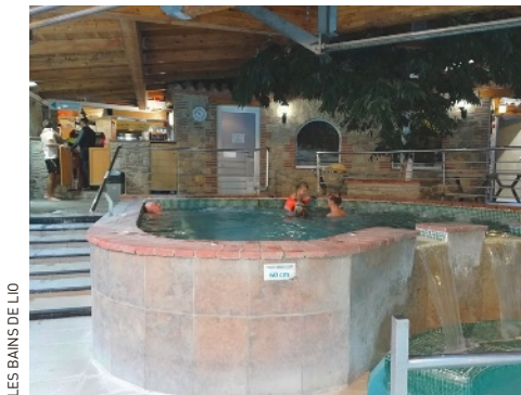
LES BAINS DE LLO

📍 À proximité du VVF Saint-Lary-Soulan Hautes-Pyrénées***