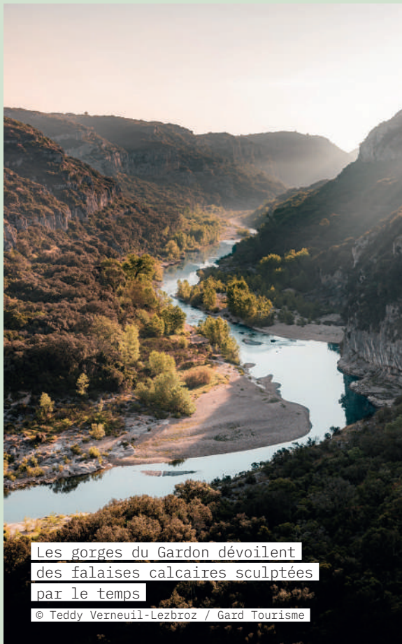
Les gorges du Gardon dévoilent des falaises calcaires sculptées par le temps