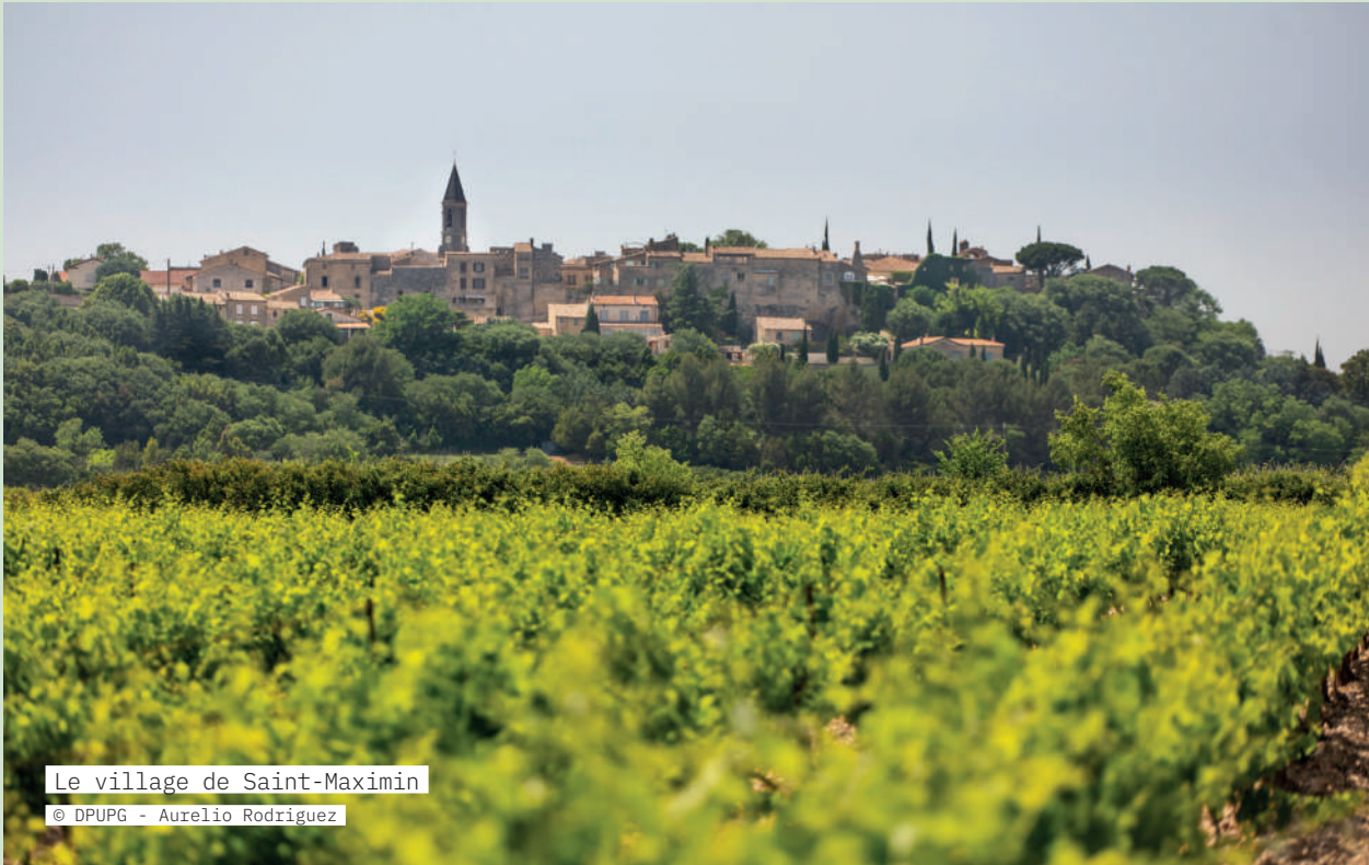
Le village de Saint-Maximin