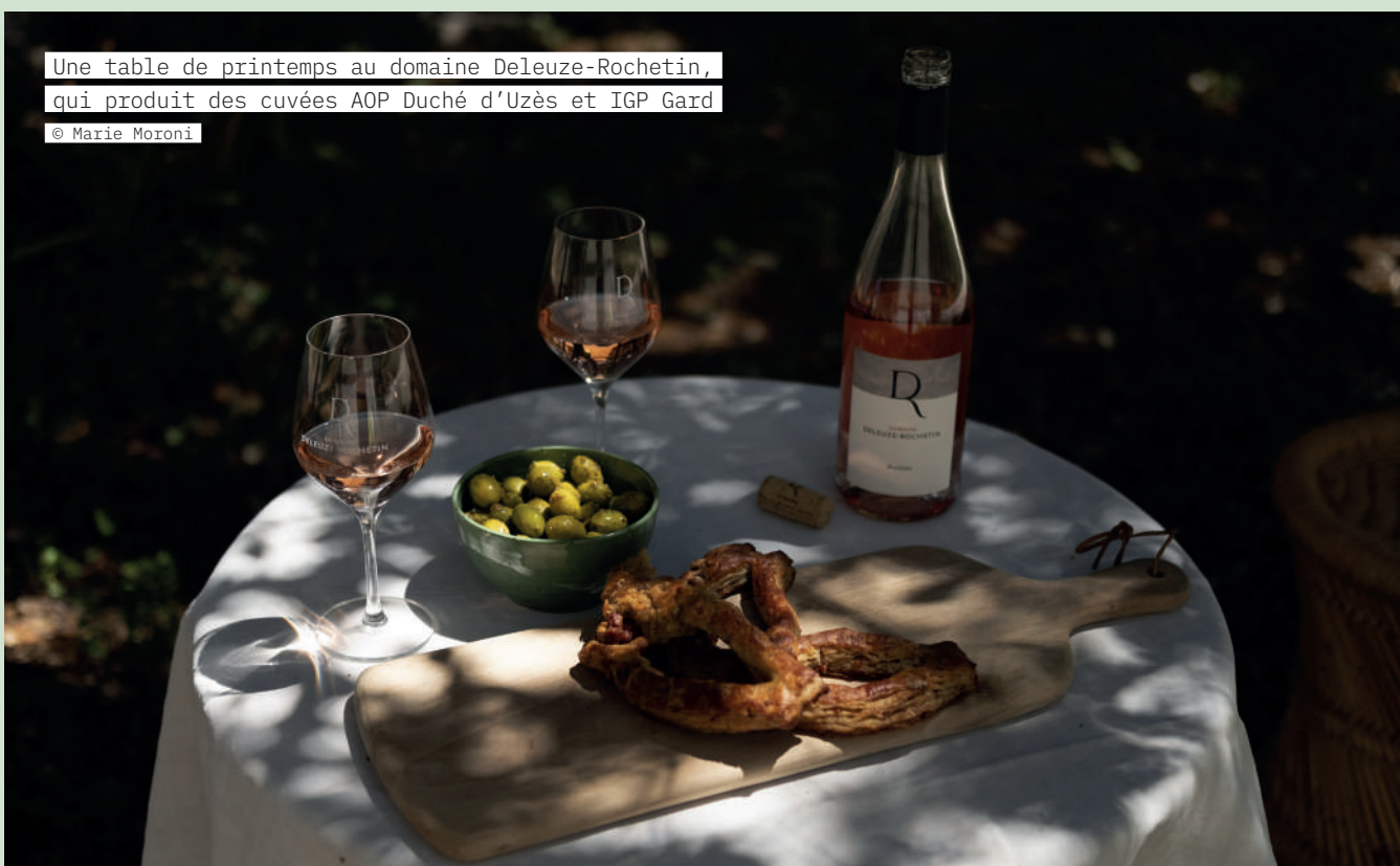
Une table de printemps au domaine Deleuze-Rochetin, qui produit des cuvées AOP Duché d'Uzès et IGP Gard