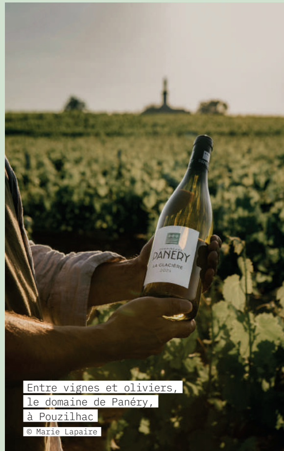
Entre vignes et oliviers, le domaine de Panéry, à Pouzilhac