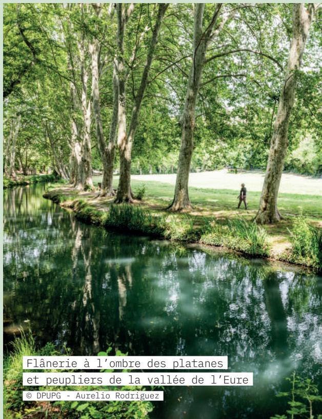
Flânerie à l'ombre des platanes et peupliers de la vallée de l'Eure

Les villages alentour prolongent l'expérience. Saint-Quentin-la-Poterie, capitale de la céramique, dévoile ses ateliers et son Musée de la Poterie Méditerranéenne, témoins d'une tradition remontant à l'époque gallo-romaine. →