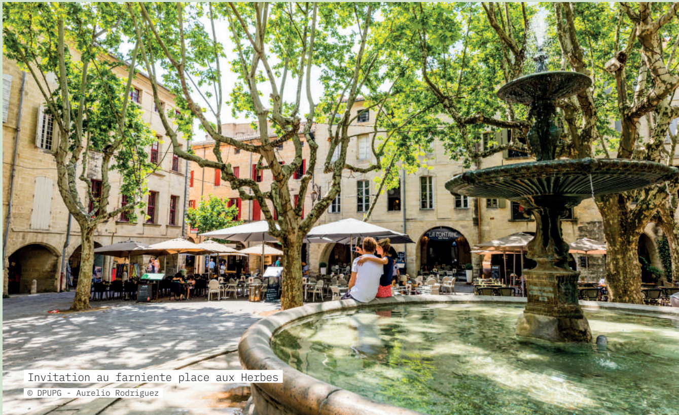
Invitation au farniente place aux Herbes