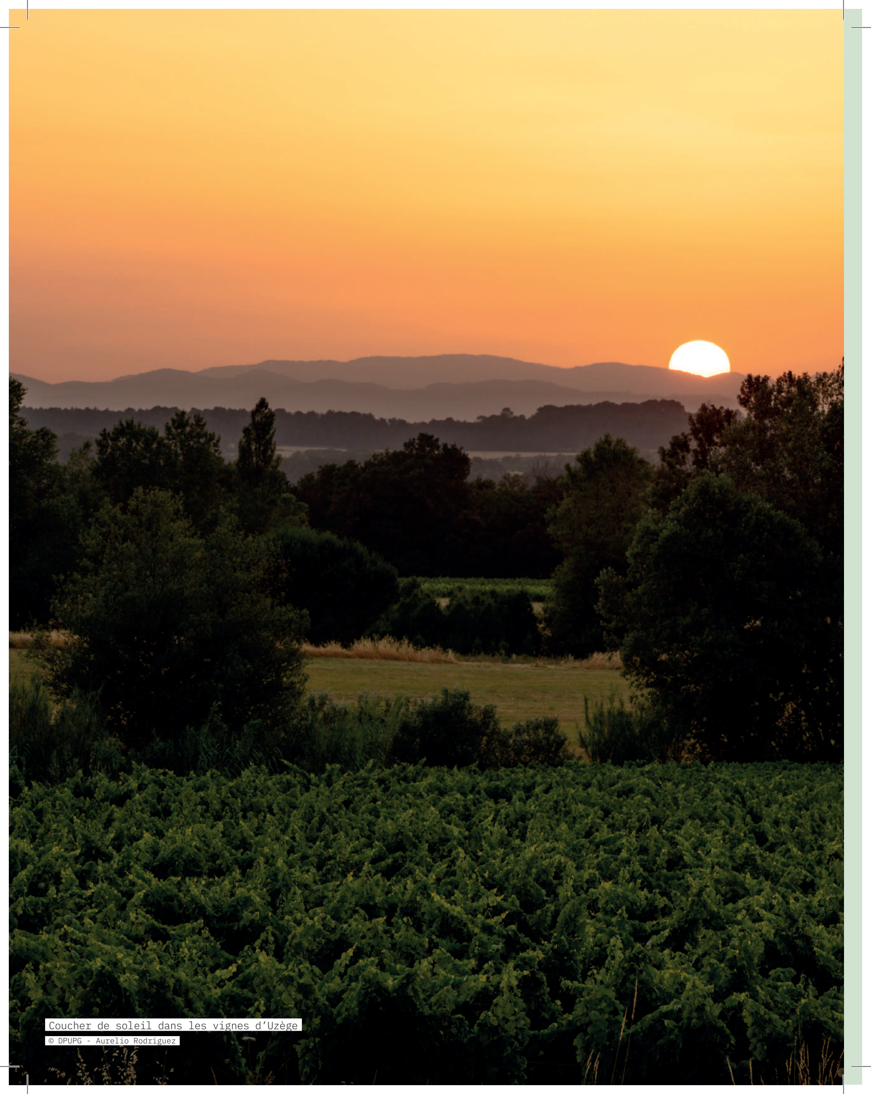
Coucher de soleil dans les vignes d'Uzège