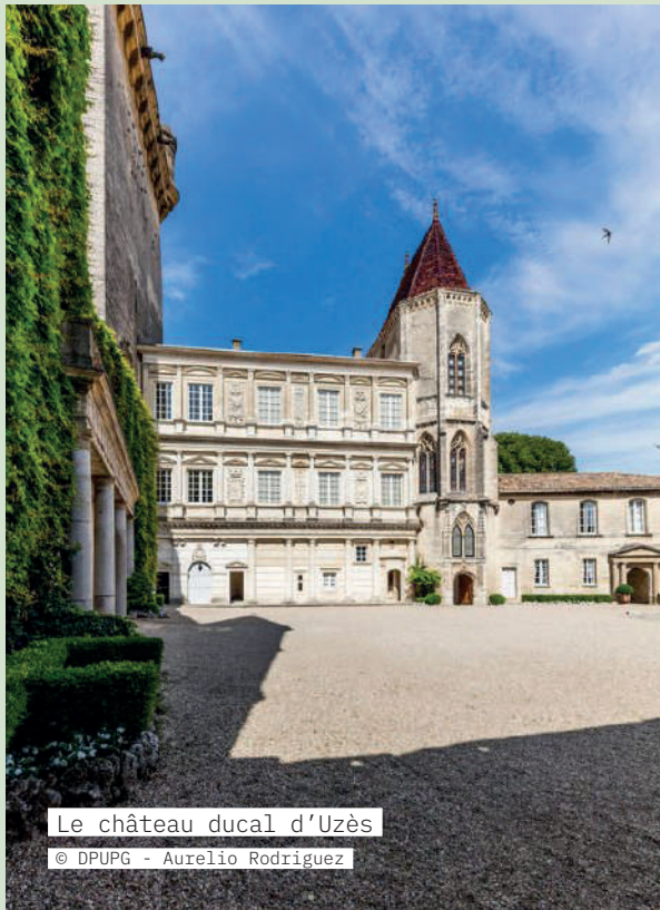
Le château ducal d'Uzès