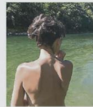
Une pratique qui se développe aussi dans l'arrière-pays.

dans le paysage touristique régional, et ses adeptes se retrouvent tous sur le sentiment de liberté que procure cette pratique. Un art de vivre qui continue, saison après saison, d'attirer bien au-delà de ses pratiquants historiques.