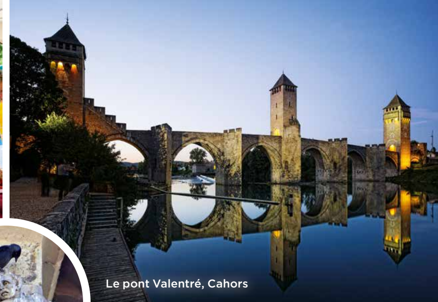
Le pont Valentré, Cahors