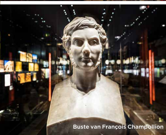
Buste van François Champollion

VANUIT TOULOUSE GLIJDT ONZE TREIN BIJNA onopgemerkt de Lot-vallei binnen. Het landschap meandert geduldig met de rivier mee: vanuit onze coupé bepalen kalksteenhellingen, bossen en wijngaarden het panorama.